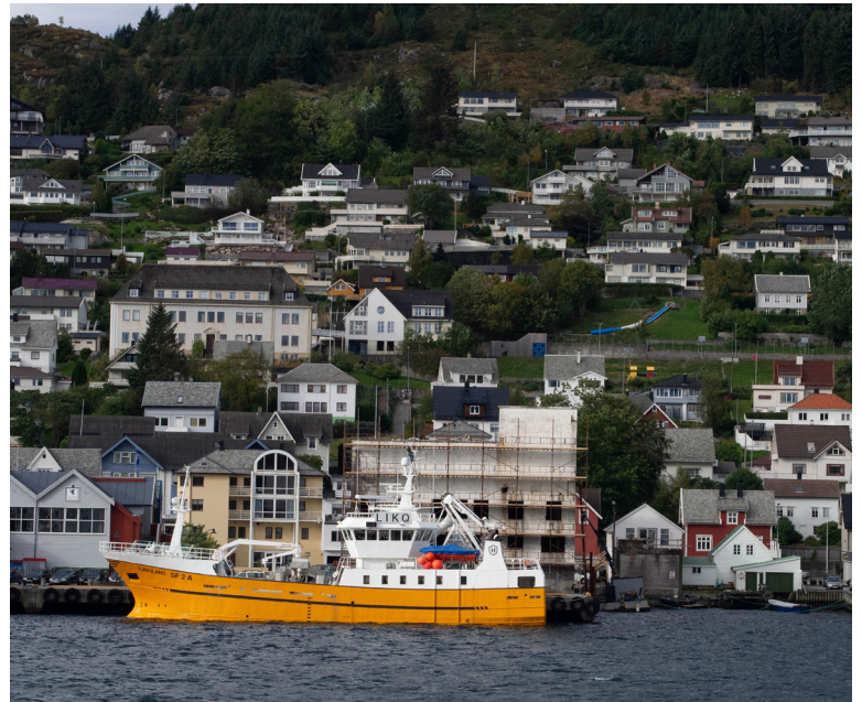
Florø, Kinn kommune.